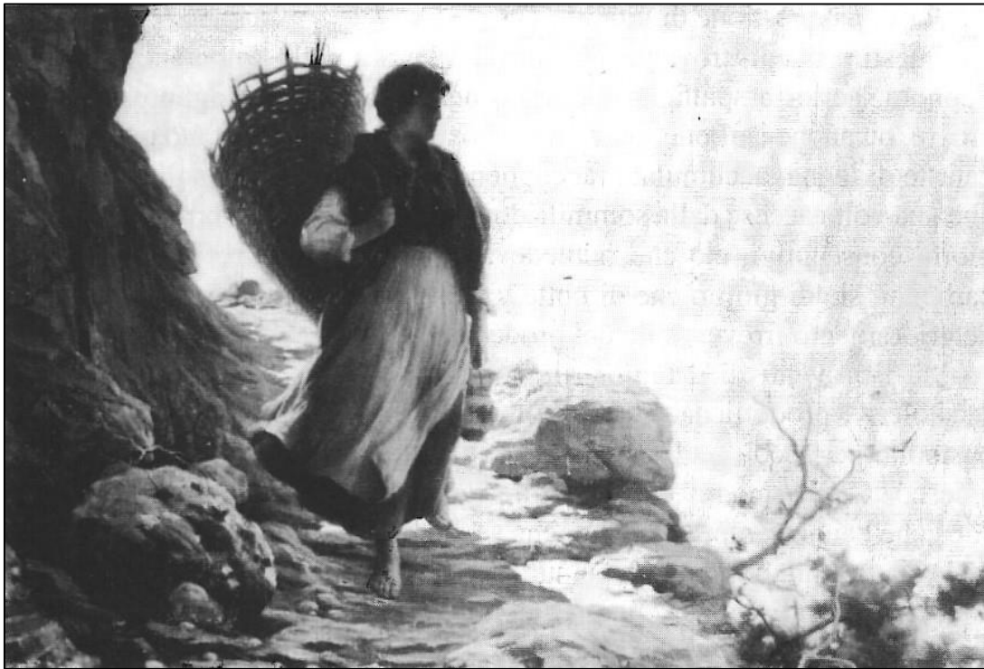
Luigi Cima "La Montanina" (cm. 143x98), Lentiai. Collezione privata

A questo sacello si legano tanti ricordi dei montanari, che avevano l'abitudine di sostarvi per riposare un pochino durante l'alpeggio; si racconta in particolare che la sera c'era la tradizione di accendere un lumino dall'ultimo dei malghesi che scendeva, per poi essere spento dal primo che saliva all'alba successiva quale punto di riferimento per quanti, durante la notte, dalla pianura avessero guardato verso "Il Santo" sulla montagna.