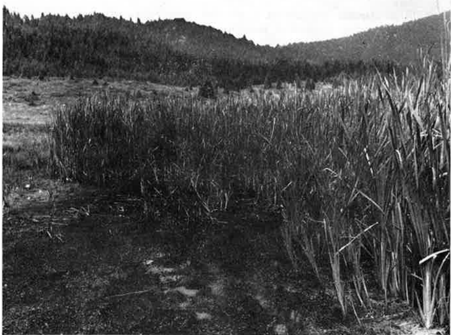
Figg. 3, 4; ambienti di particolare interesse faunistico. Sopra: Staz. 16, Lamaraz di Pian Cansiglio, è visibile la pozza centrale libera dalla vegetazione e in alto, presso il bestiame, l'argine del grande invaso coperto dallo sfagno. Sotto: Staz. 11, Lamona di Valmenera.