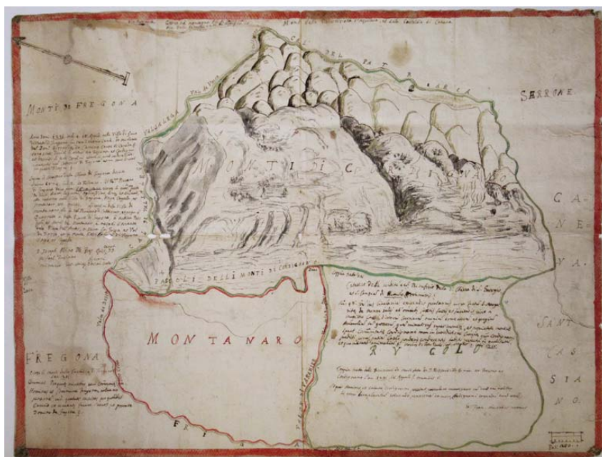
Monti di Cordignano (disegno a colori, cm. 43x55 ca.), sec. XVIII. Sulla sinistra la Strada Remera che scendeva per Valsalega. Vittorio Veneto, Archivio Diocesano.