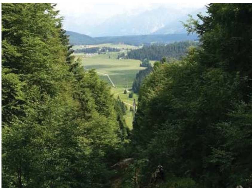
Le Code viste da La Crosetta, con sullo sfondo la Piana del Cansiglio.