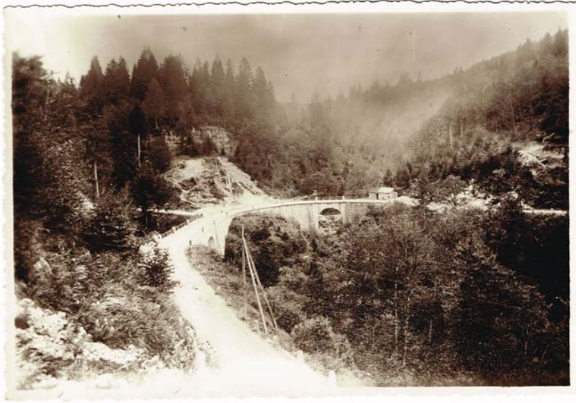
Località Due Ponti negli anni Trenta del Novecento - Strada del Cansiglio, completata nel 1881.

le locazioni concesse dal Convento di San Francesco di Conegliano, all'esterno del bosco bandito, ai fregonesi per la monticazione: