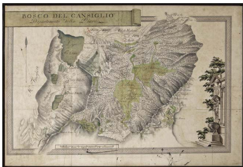
Mappa del Bosco del Cansiglio (china ed acquerello, cm. 63x85 ca.). Rielaborazione della carta topografica del generale, barone Anton von Zach, post 1805. Vittorio Veneto, Museo Diocesano d'Arte Sacra 'Albino Luciani'.

Ed è proprio per questa variante che, incredibilmente, la sera del 5 luglio 1842, transitò l'Arciduca Stefano d'Asburgo con il suo seguito per il pernottamento a Ceneda. Sua Altezza Imperiale aveva attraversato il Cansiglio e per Valsalega, Osigo, Piai e Fregona, dove, nella